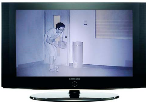
Image réelle prise à partir de cette camera en infrarouge.